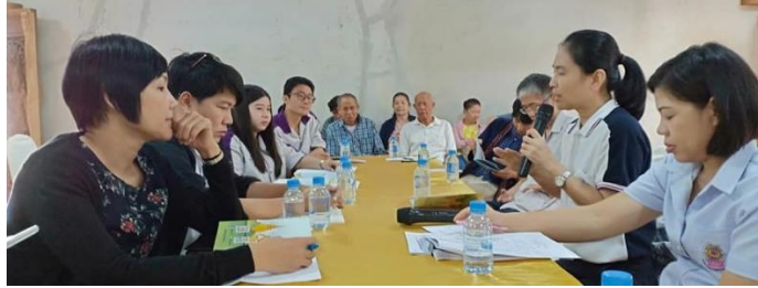
ภาพที่ 2 ประชุมคณะกรรมการ ชุมชน และเครือข่าย